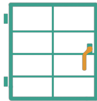
Spröjsfönster 2 sidor (upp till 8 spröjs)