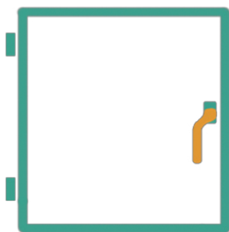
Basfönster 2 sidor